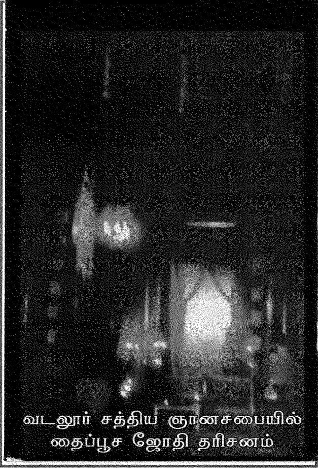
வடலூர் சத்திய ஞானசபையில் தைப்பூச ஜோதி தரிசனம்