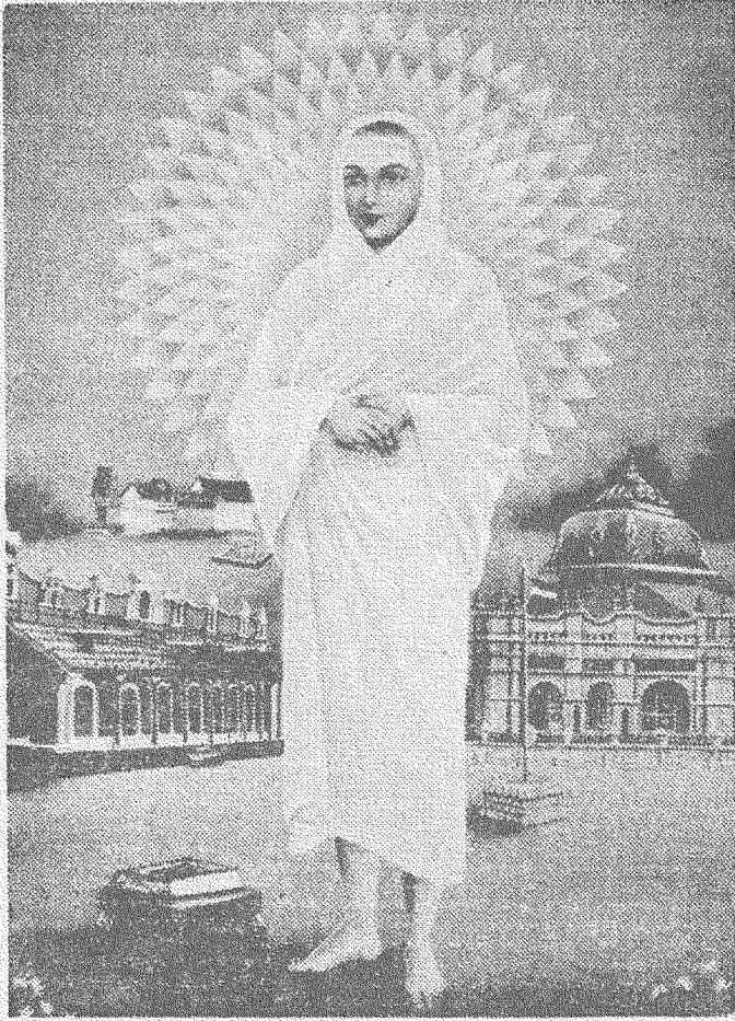
திரு அருட்பிரகாச வள்ளலார்